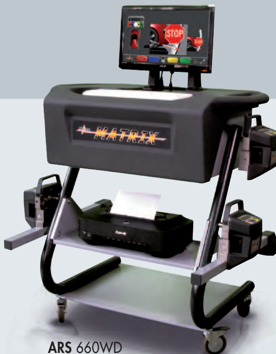
ARS 660WD 6CCD датчиков