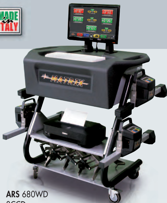
ARS 680WD 8CCD датчиков